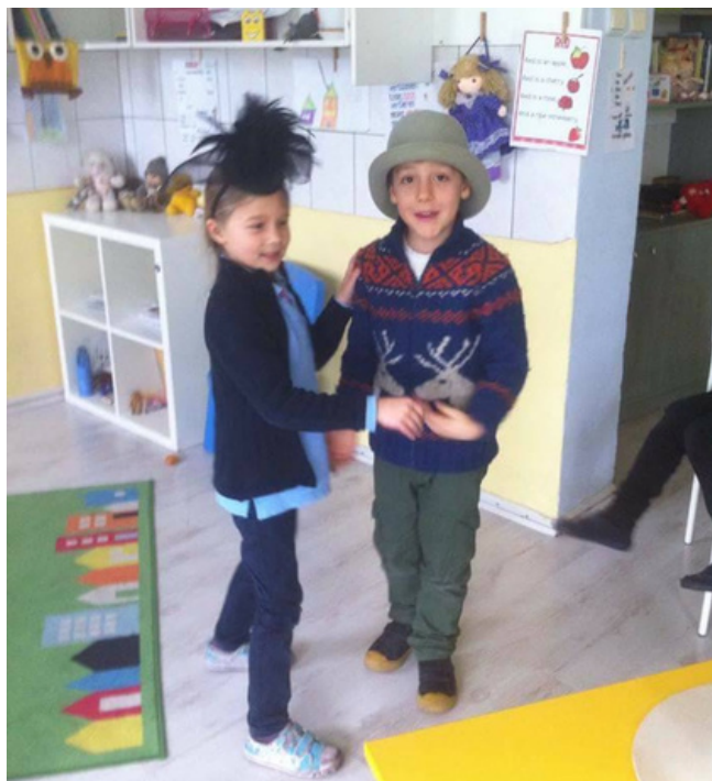
Учебна програма по английски език за периода 2016 – 2023 г.

През 2023 г. завърши своето основно образование първата сугестопедична паралелка в ЧСУ „Ръорих“. Тя е част от изпълнение на иновативен проект „Класическа Сугестопедия в начален и прогимназиален етап“ и поставя началото на прилагане на метода в ЧСУ „Ръорих“ по предметите английски език, български език, музика и спорт.