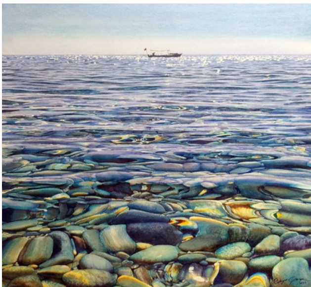
Rukie Garib, акварел, 76x56 см

Калиграфията прави написаното да изглежда природно красиво – бионично – плавно и завършено. Тогава резултатът от съзнателното действие „писане” повлиява на нашето подсъзнание – правини по-щастливи и следователно по-готови за усвояване на света и учебния материал. По-отворени за учене и постигане. Така разкриваме още от моите и на учениците ми резерви и потенциал, които дори не сме подозирали, че носим.