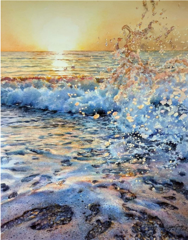
Rukie Garib, акварел, 76x56 см

РАДКА КАРАГЪОЗОВА, ЕВЕЛИНА КРЪСТЕВА, НИНА ИЛИЕВА, ЗЛАТИНА ДИМИТРОВА, ЕВДОКИЯ РАЕВА*