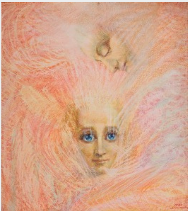
Лили Димкова, „Духът на обещанието“